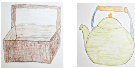
RYSUNEK 2. Zabawa w „Tajemny szyfr”