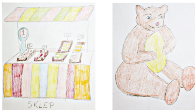
RYSUNEK 3. „Zabawki idą na zakupy”