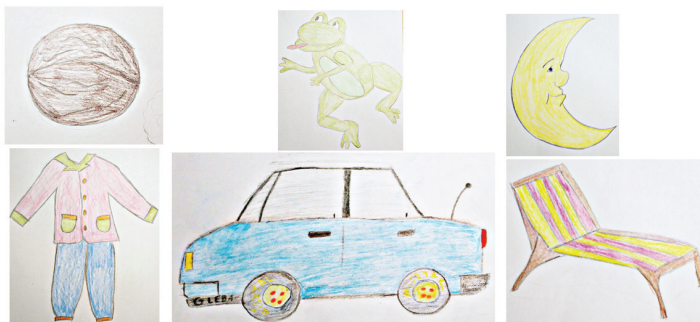
RYSUNEK 1. Przykładowy garaż